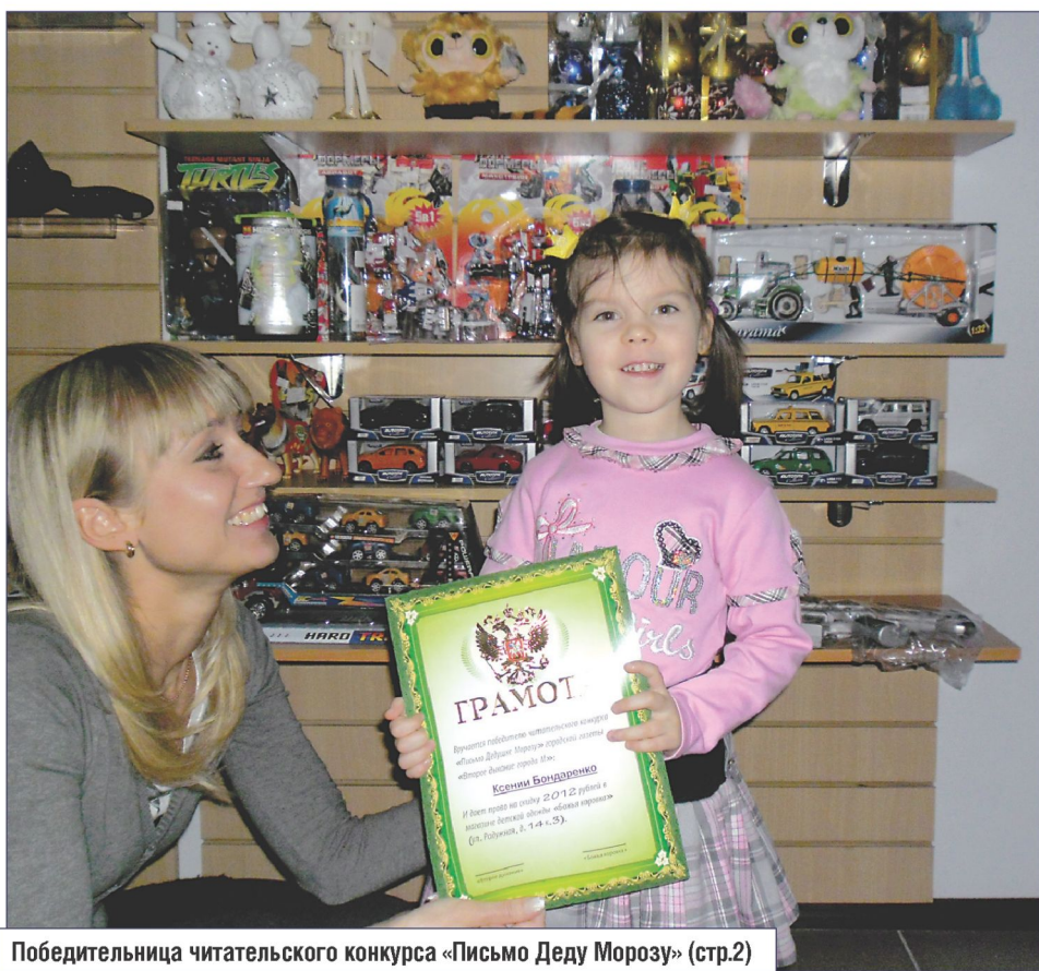
Победительница читательского конкурса «Письмо Деду Морозу» (стр.2)