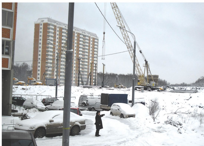
Расстояние от 17 дома

будням) в основном около девяти часов утра. Его продолжительность бывает не более 5 минут! При проектировании звонницы будут достигнуты нормативные уровни звукового фона, создаваемого колокольным звоном, в близлежащих зданиях, требующих специфического шумового режима в соответствии с СНиП «Защита от шума».