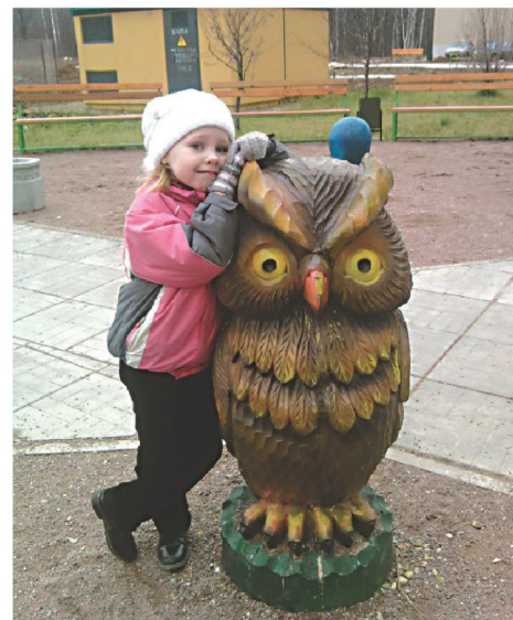
«Хвалите меня, хвалите»

5. Оказывайте помощь – делом, советом, одобряющим взглядом. Не вмешивайтесь, если ребёнок не просит о помощи, тем самым вы говорите «ты справишься». Если ребёнку трудно, и он готов принять помощь, обязательно помогите ему, но возьмите на себя только то, что он сам не может выполнить. Помогите в жизненных ситуациях советом, приведите пример из собственного опыта и обязательно придайте своему рассказу оптимистическую нотку. Сами просите о помощи ребёнка,