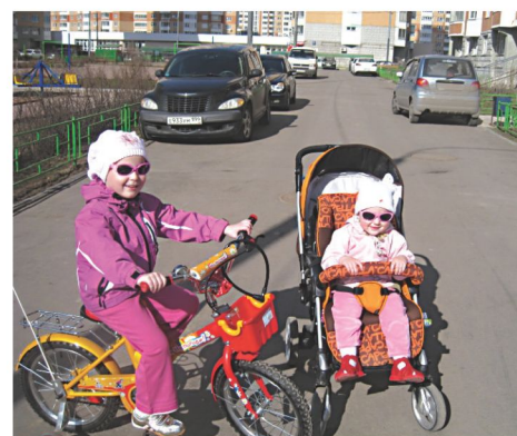
«Решаем любые проблемы — оперативно выезжаем в любую точку города»

спрашивайте совета. Общение с взрослым ускоряет его развитие, он черпает образцы для подражания. Позволяйте делать детям ошибки и встречаться с их последствиями. Но ребёнок должен знать: чтобы не случилось, он всегда может рассчитывать на вашу помощь, без условий.