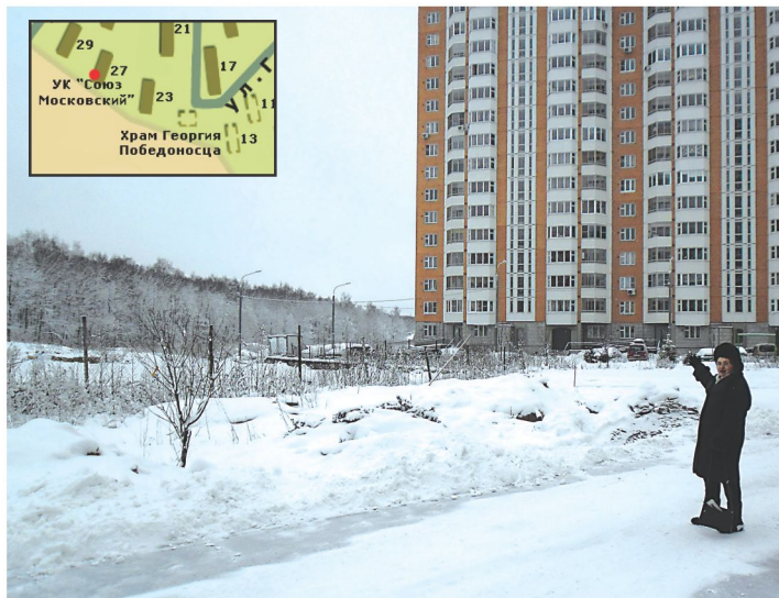
Расстояние от 23 дома

Колокольный звон обычно собирает людей к началу праздничного богослужения (чаще в воскресные дни, и реже по