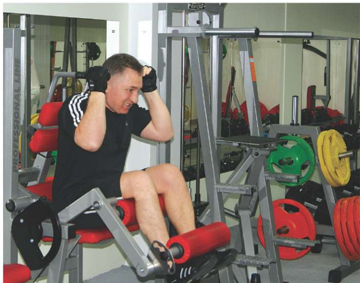
Силовые тренажеры на любой вкус

Вот и в нашем городе открылся фитнес-клуб. Приоритетной задачей клуба «RaiSport-Московский» является — создание доступного фитнеса всем желающим. Гибкая система скидок: студентам, школьникам, пенсионерам.