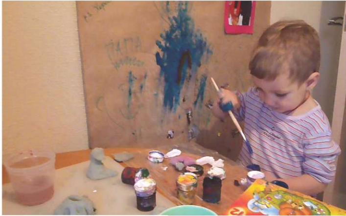
«Главное в творчестве — процесс!»

Мастерить и Творить вместе вдвойне приятно — это ценное общение, совместная радость и всестороннее развитие малыша.