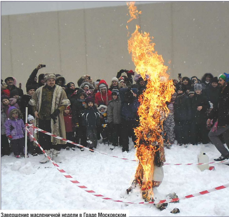
Завершение масленичной недели в Граде Московском