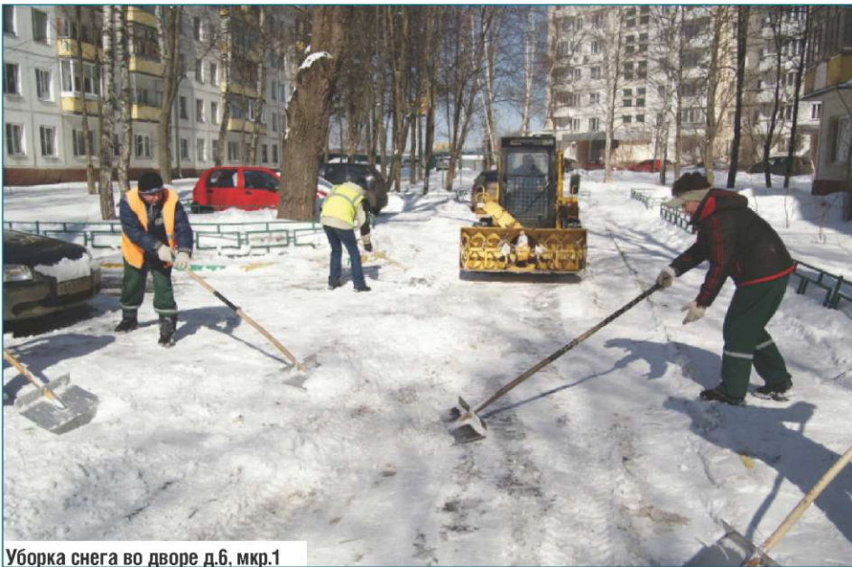
Уборка снега во дворе д.б. мкр.1