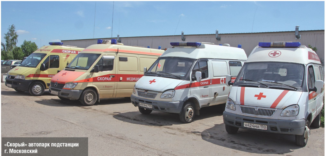
«Скорый» автопарк подстанции г. Московский

мывались, сколько, кого и где обслуживает Подстанция г. Московский Видновской Скорой? Я однажды посчитал и вновь подивился нашим своеобразным русским подходом к созданию условий и требованиям даже в медицине. Мы обслуживаем территорию равную современной Бельгии 6-ю машинами «скорой помощи». В Бельгии более 150 бригад «скорой». Кроме Московского с его новыми микрорайонами, Коммунарка, Теплый Стан, Мосрентген, от деревни Потапово, пос. Писателей до Кувейтово, Валуево и Внуково... Устанешь считать. На территории 3 рынка, крупные торговые центры «Мега», «Оби», «Ашан», в которых кому-то стало плохо с сердцем,